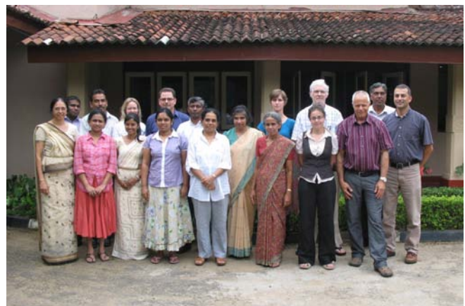
Représentants sri lankais et du CCCSF au Sri Lanka, juillet 2010