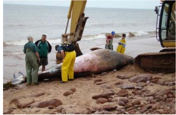
Petit rorqual sur la côte nord de l'IPE, juin 2010

Pierre-Yves Daoust, CCCSF – région de l'Atlantique