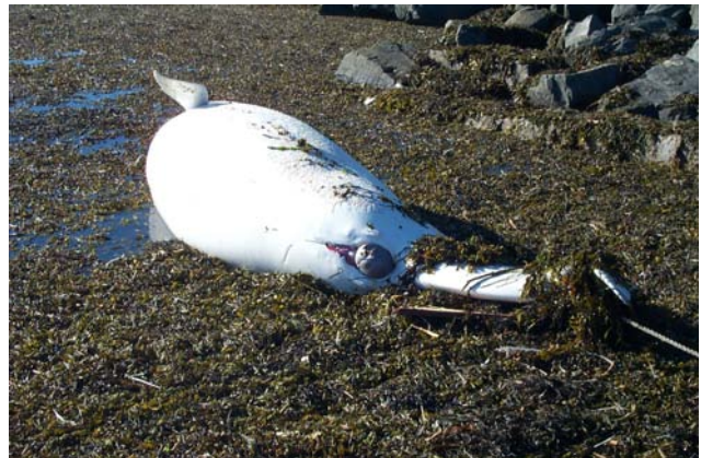
Carcasse d'une femelle béluga échouée des suites d'une dystocie. La tête grise du veau peut être aperçue dans la fente génitale distendue.

Stéphane Lair et Sylvain Larrat, CCCSF – Centre régional du Québec