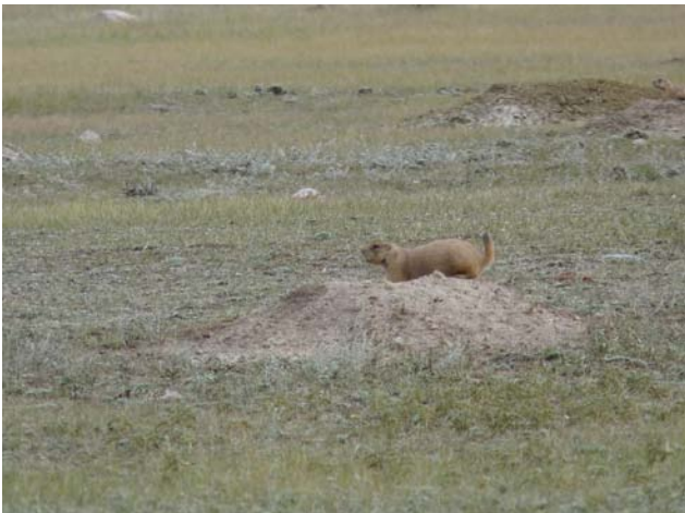
Chien de prairie à queue noire

La découverte de Y. pestis chez un chien de prairie amena la parution d'un bulletin d'information local le 13 août pour alerter les médias locaux et régionaux de la