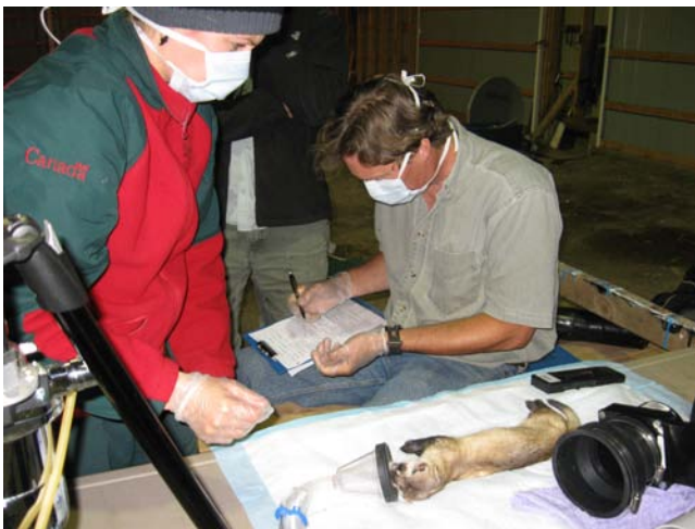
Putois à pattes noires sous anesthésie et en cours de procédures au parc national des Prairies

Suite à une relâche réussie de 34 putois à pattes noires ( Mustela nigripes ) en octobre 2009 (voir le bulletin de décembre 2009), le personnel et les bénévoles du Parc national des Prairies dans le sud de la Saskatchewan ont suivi le succès de cette tentative de réintroduction. Quinze putois supplémentaires, nés en captivité, ont été relâchés le 23 septembre 2010 afin d'augmenter la population existante et d'aider au rétablissement de cette espèce au Canada. C'est la seule population de putois à pattes noires au Canada and elle existe à l'intérieur de l'aire de distribution de sa proie principale, le chien de prairie à queue noire ( Cynomys ludovicianus ), qui est présent