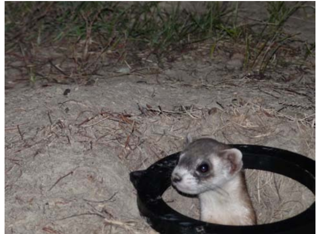
Putois à pattes noires durant la lecture de sa micropuce au parc national des Prairies

femelle en lactation a également été découverte. Les petits furent anesthésiés avec un appareil à anesthésie gazeuse portable, furent micropucés et furent vaccinés contre la peste sylvatique et le distemper canin : deux maladies qui ont été identifiées comme étant des menaces majeures à la Black-Footed Ferret Recovery Strategy . Ces bébés sont considérés comme étant très importants au programme de rétablissement de la population puisque cela indique que la population se reproduit avec succès dans les conditions canadiennes et cela est de bon augure pour la croissance future de cette très fragile population de carnivores des prairies. Cet effort de réintroduction fait partie d'un projet de cinq ans intitulé Prairie restored: Building the Grasslands Experience . Plus d'informations sur le rétablissement de la population de putois à pattes noires et sur le Parc national des Prairies peuvent être obtenues au http://www.pc.gc.ca/eng/pn-np/sk/grasslands/index.aspx ou en appelant au (306) 298-2166 poste 231.