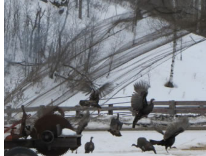
Lance-filet pneumatique – crédit photo : F. Baldwin, MB Conservation

L. Bryan, CCCSF région du nord et de l'ouest